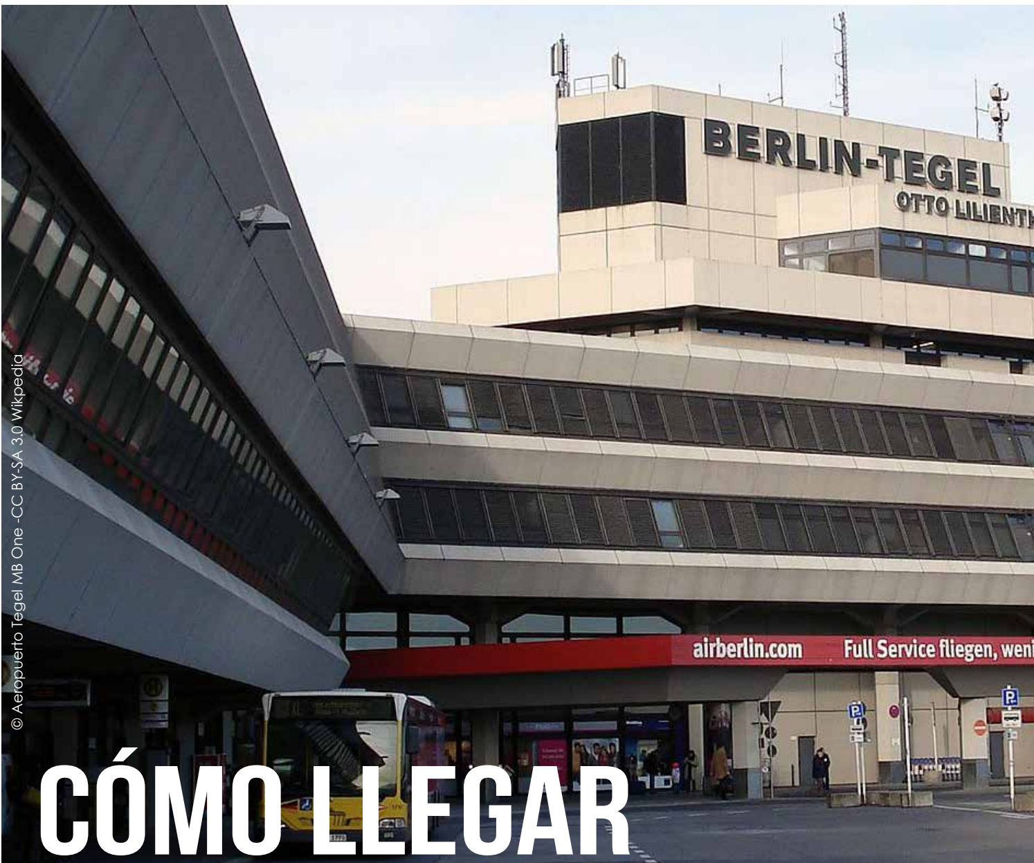
© Aeropuerto Tegel MB One -CC BY-SA 3.0 Wikipedia